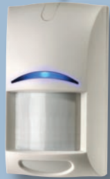
Module caméra couleur ISM-BLA1-CC Module caméra noir et blanc ISM-BLA1-CM