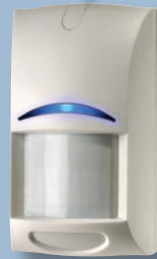
Module avertisseur sonore ISM-BLA1-SM