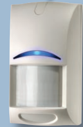
Module veilleuse de nuit ISM-BLA1-LM